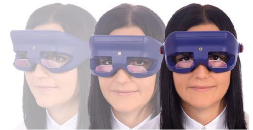
Abdeckung der Augen zur Unterdrückung der Fixation (z.B. für Kalorik)